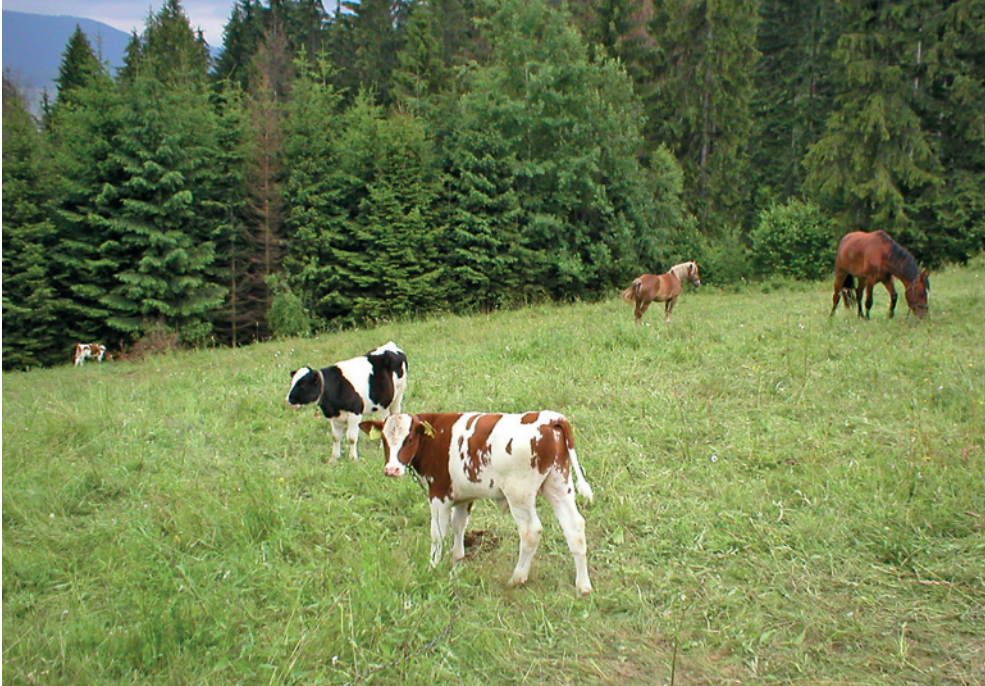
Fot. 8. Bydło i konie pozostawione bez nadzoru na leśnej polanie w Beskidzie Śląskim. Taki sposób wypasu zwiększa ryzyko ataku wilków