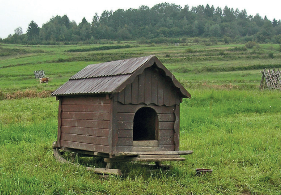
Fot. 13. Buda służąca za schronienie dla owczarka podhalańskiego na pastwisku w Beskidzie Śląskim. Posadowienie budy na płozach ułatwia jej transport

Owczarki podhalańskie mają długą sierść, która wymaga regularnej pielęgnacji, powinno się je zatem szczotkować raz w tygodniu. Dłuższe włosy za uszami i na łapach można rozczesać grzebieniem z metalowymi zębami. Owczarki linieją dwa razy w roku. W tym okresie zaleca się częstsze szczotkowanie psa. W trakcie pielęgnacji zwracać należy szczególną uwagę na wszelkie zmiany skórne, a także dokładnie sprawdzać uszy i oczy. Przy okazji warto skontrolować skórę psa pod kątem występowania pasożytów zewnętrznych.